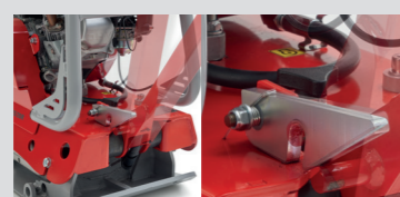
Fermo per alzare/abbassare il manubrio