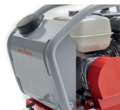
Serbatoio acqua incluso