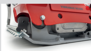
Piastra in acciaio sagomato