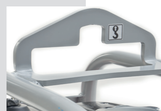
Gancio di sollevamento