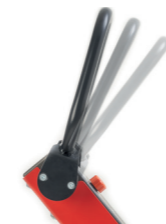
Leva spostamento avanti / indietro