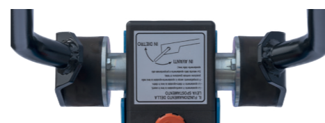
Gommini antivibratori al manubrio