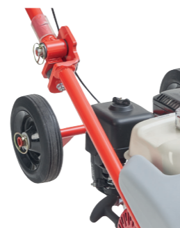
Ruote a passo largo e integrate