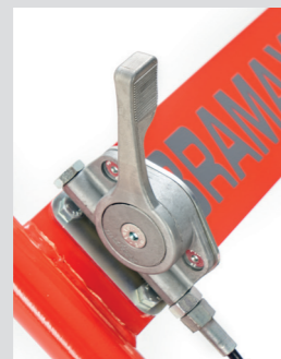
Leva acceleratore con blocco in "folle"