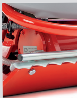
Barra paracolpi e zigrinatura per gocciolatoio