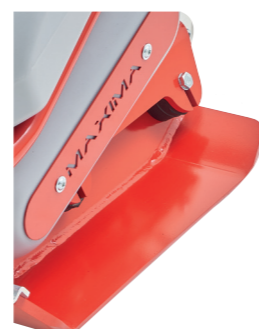
Piastra in acciaio incrementato di manganese laminato a caldo, sagomato e garantito 6 anni