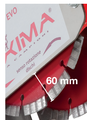
Profondità fino a 60 mm