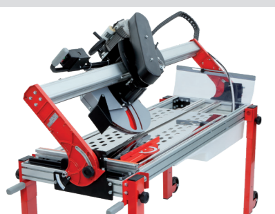
Inclinabile a 45° e scorrimento preciso e scorrevole