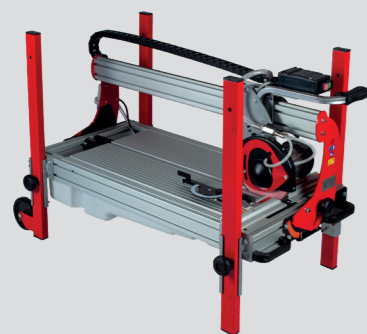
Facile da trasportare