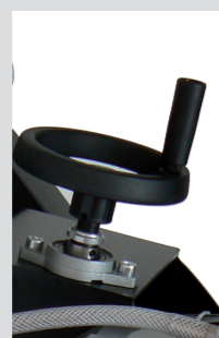
Regolazione altezza taglio