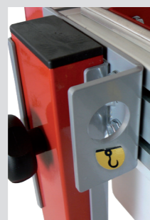
Facile da movimentare