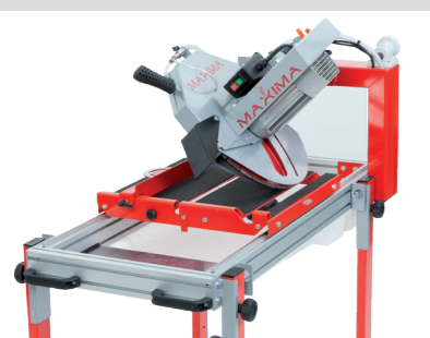
Inclinabile a 45° e scorrimento preciso e scorrevole