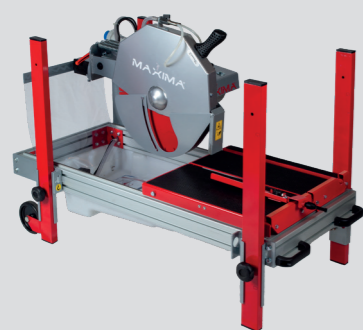
Facile da trasportare