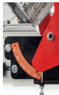
Indicatore di inclinazione a 45°