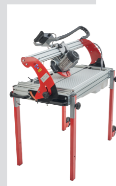
Inclinabile a 45°