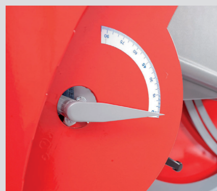
Indicatore di profondità di taglio