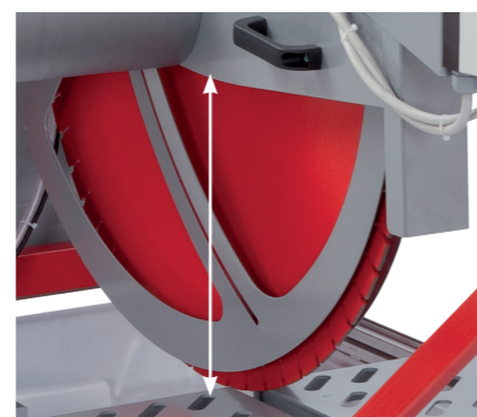
L'altezza di taglio è di 400/600 mm