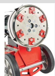
Piatto robusto fino a 6 moduli