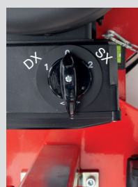
Interruttore con invertitore di direzione