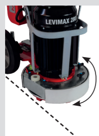
Filoparete sia a destra che a sinistra