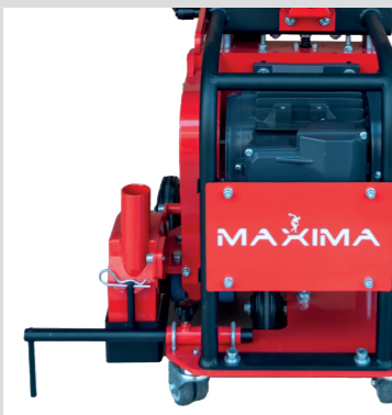
Distanziale per fresature parallele