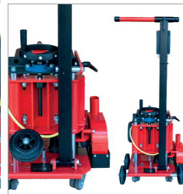
Ruota estraibile - Impugnatura regolabile per filo-parete