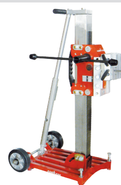
Colonna interamente in acciaio