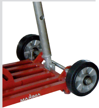
Ruote per un facile trasporto