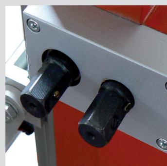
Sistema di avanzamento a doppia velocità del carrello motore