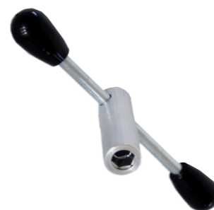
Argano / Chiave inglese