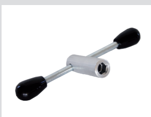
Argano / Chiave inglese