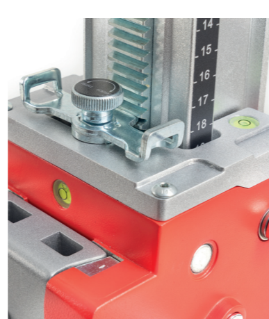
Doppia livella e leva per arresto calata