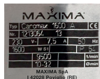
Motore ad alta velocità: 9500 Giri / Min