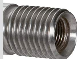
Connettore 1"1/4 - 1/2 gas